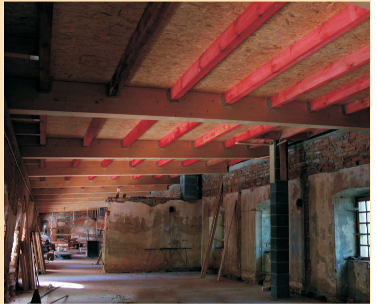
Prace remontowe w Pałacu